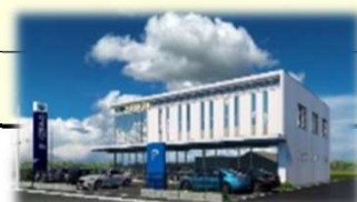
【新店舗外観イメージ】