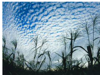
「うろこ雲」 浅岡 由次さま(知立市) ＜撮影地＞安城市 城ヶ入町