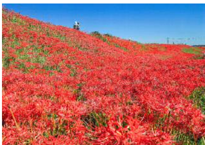
「真紅の堤防」 山口 清美さま(名古屋市) ＜撮影地＞半田市 矢勝川堤