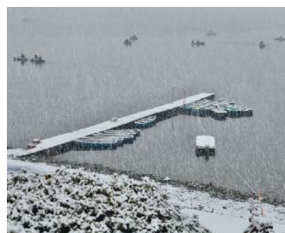
「雪降りのワカサギ釣り」 玉置 良宗さま(小牧市) ＜撮影地＞犬山市 入鹿池