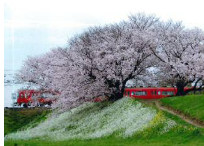
「桜トンネル」 細井 哲雄さま(安城市) ＜撮影地＞西尾市 吉良町