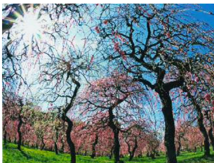
「訪春」 深見 玲子さま(名古屋市) ＜撮影地＞名古屋市 天白町