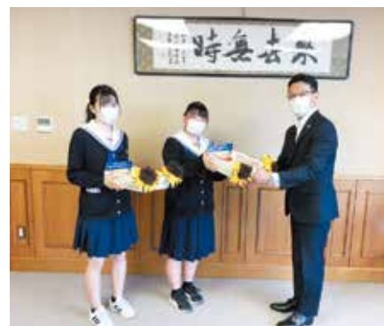
安城学園高等学校が参加する「福島ひまわり里親プロジェクト」に協力(6月8日)