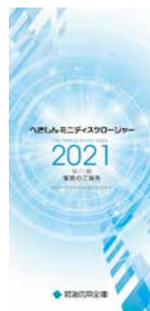
「へきしんミニディスクロージャー2021」を発行(6月22日)

当金庫では、主要な経営情報を四半期ごとに開示しております。今後とも、積極的な情報開示に努めてまいります。