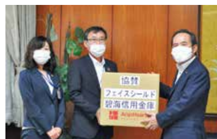
安城市へフェイスシールドを寄贈(6月15日)