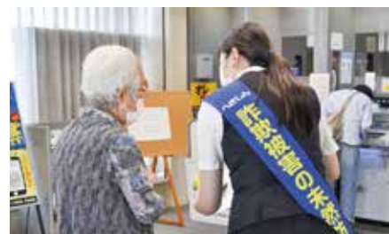
「詐欺被害未然防止活動」を実施(6月15日)