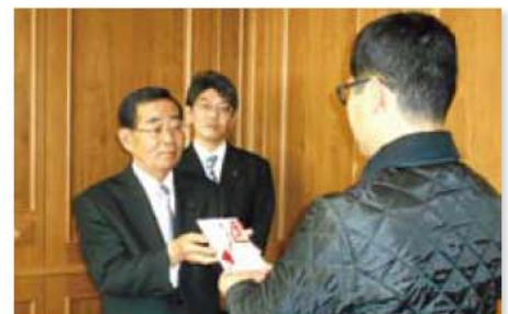
中日新聞「年末助け合い運動」で募金を実施 (12月17日)

当金庫では、主要な経営情報を四半期ごとに開示しております。今後とも、積極的な情報開示に努めてまいります。