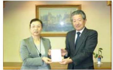
安城市市民協働推進基金へ寄附 (10月30日)