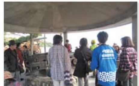
「福岡・山口の世界遺産をめぐる旅」観光旅行を実施 (11月10日~)