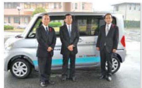
安城市社会福祉協議会へ福祉車両を寄贈 (11月18日)