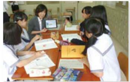
地域高校で「プロフェッショナルにインタビュー講座」を実施(5月28日)