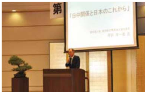
前中国大使、前伊藤忠商事株式会社社長 丹羽宇一郎氏による基調講演