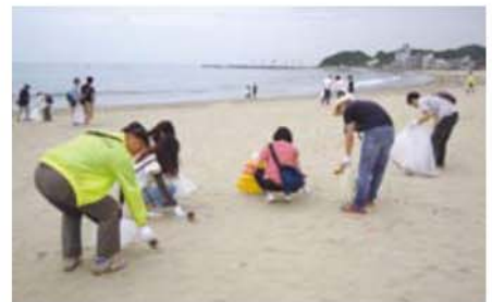
「知多半島海水浴場クリーン作戦」を実施(6月20日)

当金庫では、主要な経営情報を四半期ごとに開示しております。今後とも、積極的な情報開示に努めてまいります。