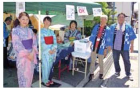
有松絞りまつりにボランティア参加(6月6、7日)