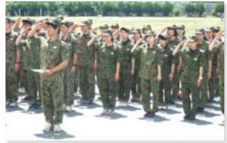
陸上自衛隊豊川駐屯地で新入職員研修を実施(5月20日～22日)