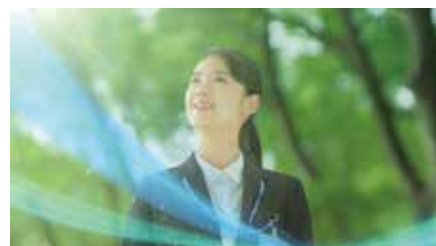
新テレビコマーシャルの放映開始(10月18日)

こちらからご覧になれます。 https://www.hekishin.jp/cm/