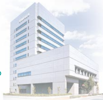
令和2年度上半期 経営報告会の開催(11月17日)