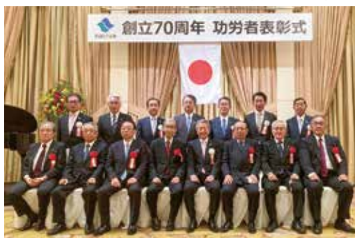
<創立70周年記念事業> 総代功労者表彰式の開催(11月9日)