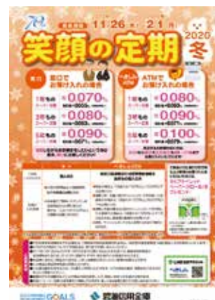
「笑顔の定期2020冬」の取扱開始(11月26日)