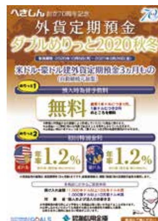
「外貨定期預金ダブルめりっと2020秋冬」の取扱開始(10月5日)