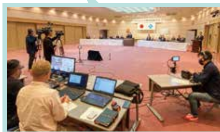
YouTubeでの生配信の様子