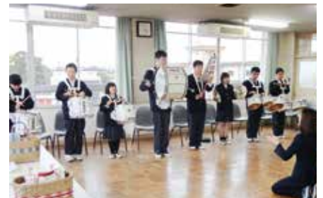
寄贈型私募債「パートナーブリッジ」の寄贈品を愛知県立安城特別支援学校に贈呈(12月6日)

当金庫では、主要な経営情報を四半期ごとに開示しております。今後とも、積極的な情報開示に努めてまいります。