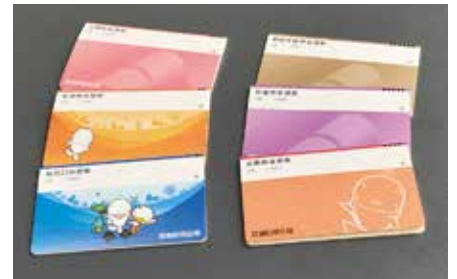
磁気不良になりにくい通帳(Hi-Co通帳)の取扱いを開始(11月18日)