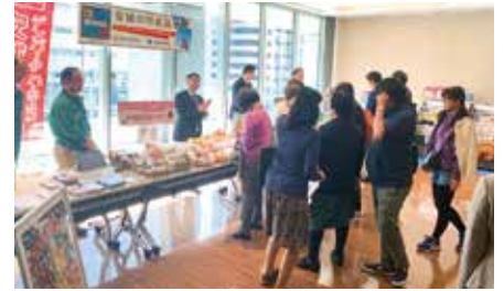
「なごやホストタウン祭」に安城市の特産品を出展(11月12日)