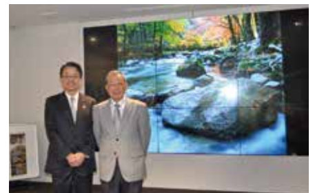
「へきしんフォトコンテスト」の表彰式を開催(11月27日)