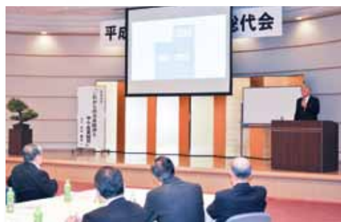
立教大学名誉教授 山口義行氏による基調講演