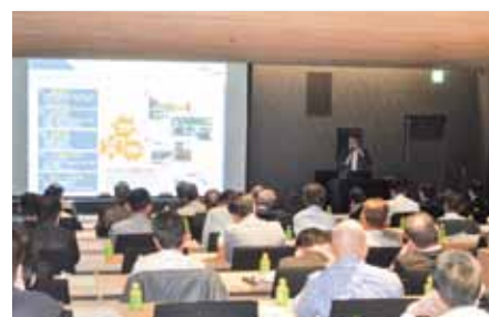
「へきしん次世代自動車セミナー」を開催(10月26日)