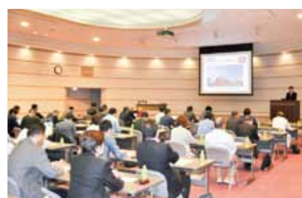
「へきしんどローン講演会」を開催(11月20日)