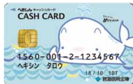
ICキャッシュカード即時発行の取扱い開始(10月22日)