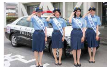
「詐欺被害未然防止活動」を実施(6月14日)

当金庫では、主要な経営情報を四半期ごとに開示しております。今後とも、積極的な情報開示に努めてまいります。