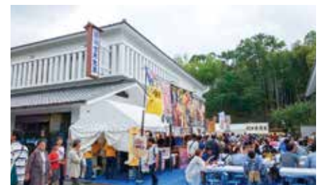
有松絞りまつりにボランティア参加(6月1日・2日)