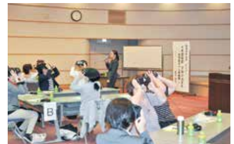
「VR認知症プロジェクト」セミナー(5月21日)