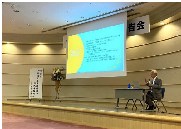
伊藤 元重 氏(東京大学名誉教授)による講演

「いいともあいち」事業の一環として 愛知県知事が本店の職員食堂を視察（10月29日）