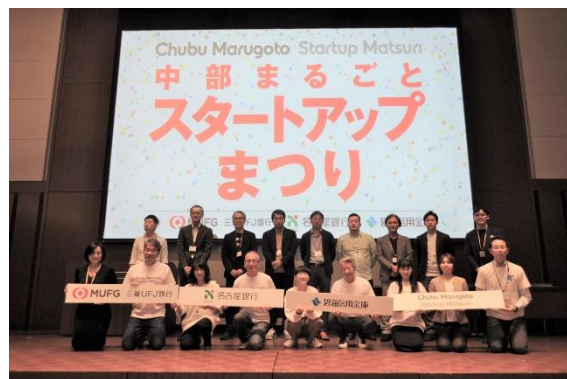
三菱UFJ銀行、名古屋銀行と初の合同イベントを開催