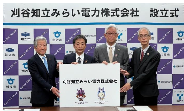
エネルギーを地域内で循環させる地産地消型の地域新電力会社を刈谷市、知立市、東邦ガス株式会社との共同出資により設立