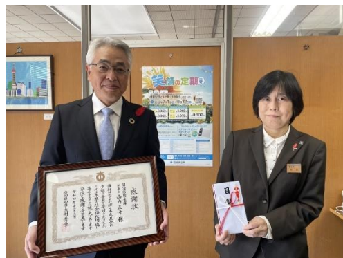
「笑顔の定期2022夏」にお預け入れていただいた残高の一定率に相当する金額を寄付