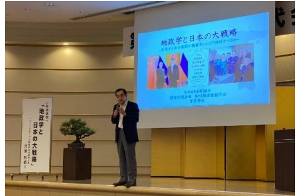
宮家邦彦氏(キャノングローバル戦略研究所研究主幹)による講演