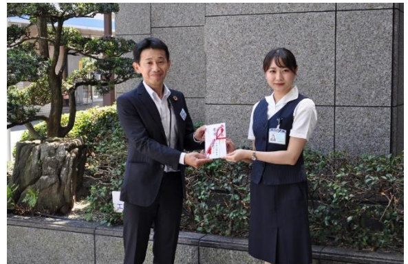
役職員から集まった募金を贈呈