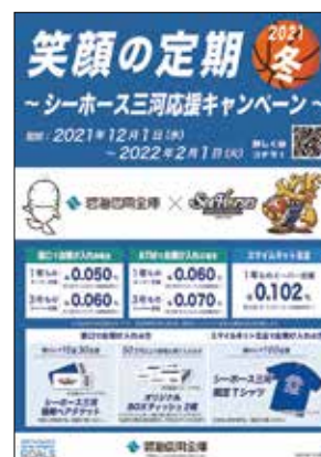
「笑顔の定期2021冬～シーホース三河応援キャンペーン～」の取扱開始(12月1日)