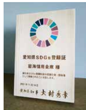
「愛知県SDGs登録制度」の登録企業に認定(11月16日)