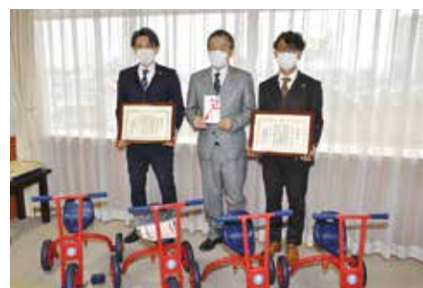
SDGs寄贈型私募債「パートナーブリッジ」寄贈品贈呈式(開催場所:大府市役所、発行企業:新生ユニオン株式会社)(12月6日)

当金庫では、主要な経営情報を四半期ごとに開示しております。今後とも、積極的な情報開示に努めてまいります。