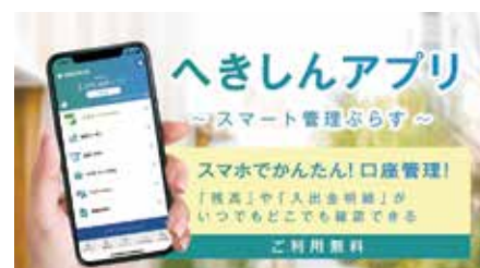
「へきしんアプリ ～スマート管理ぶらす～」 リニューアル(6月15日)