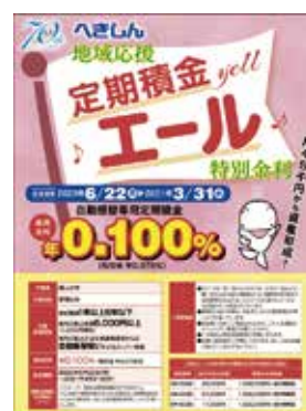
自動振替専用定期積金「yell(エール)」 取扱開始(6月22日)

当金庫では、主要な経営情報を四半期ごとに開示しております。今後とも、積極的な情報開示に努めてまいります。