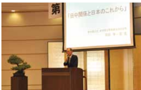
前中国大使、前伊藤忠商事株式会社社長 丹羽宇一郎氏による基調講演