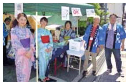
有松絞りまつりにボランティア参加 (6月6、7日)