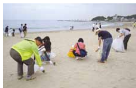
「知多半島海水浴場クリーン作戦」を実施 (6月20日)

当金庫では、主要な経営情報を四半期ごとに開示しております。今後とも、積極的な情報開示に努めてまいります。