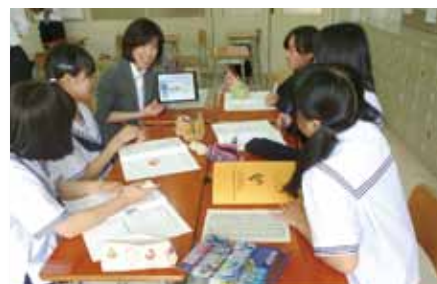
地域高校で「プロフェッショナルにインタビュー講座」を実施(5月28日)