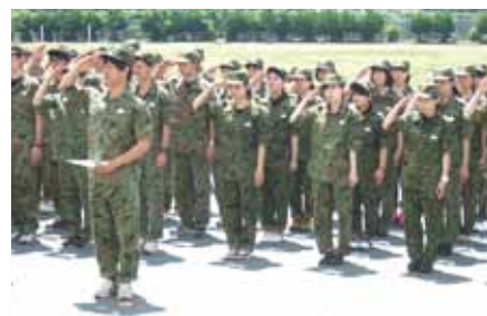
陸上自衛隊豊川駐屯地で新入職員研修を実施 (5月20日～22日)