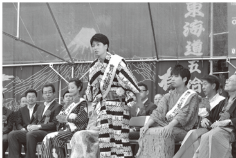
有松絞りまつりにボランティア参加(6月7、8日) 当金庫職員(写真中央)が有松福男として活躍