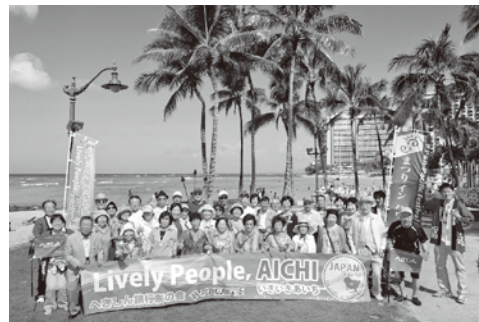
「へきしん旅行友の会」観光旅行を実施(6月12～17日) ハワイで開催された「まつり イン ハワイ」に参加