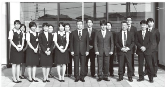
所在地: 知多郡東浦町大字緒川字家下9番地の5 TEL: 0562-83-1223