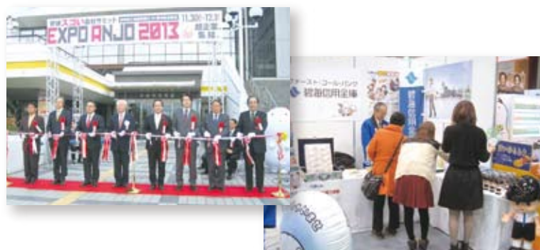
安城商工会議所創立60周年記念事業 「安城スゴい会社サミット」へ出展(11月30日、12月1日)

当金庫では、主要な経営情報を四半期ごとに開示しております。今後とも、積極的な情報開示に努めてまいります。