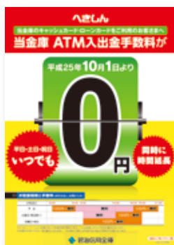
「ATM休日・時間外手数料無料サービス」の開始(10月1日)