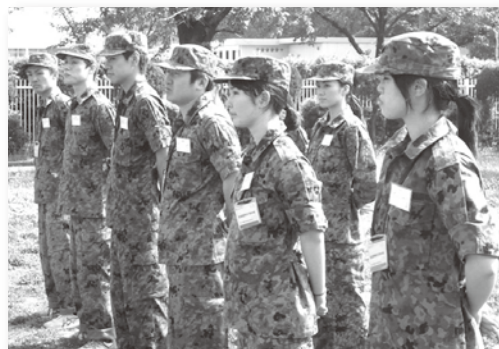
陸上自衛隊豊川駐屯地で新入職員研修を実施(5月22～24日)

当金庫では、主要な経営情報を四半期ごとに開示しております。今後とも、積極的な情報開示に努めてまいります。