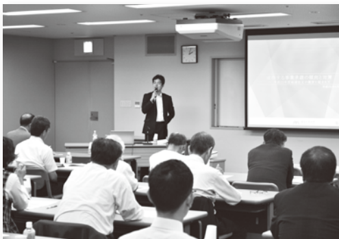
「へきしん事業承継セミナー」を開催(6月7日)