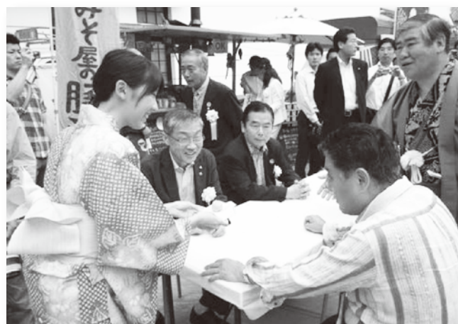
有松絞りまつりに浴衣姿でボランティア参加(6月1、2日)