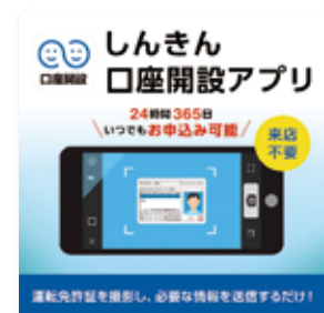
スマートフォンによる口座開設サービスの取扱い開始(5月1日)