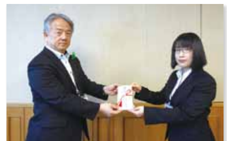
「緑の募金」を実施(6月12日)