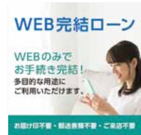
インターネットによるWEB完結ローンの取扱い開始(4月20日)