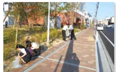
「信用金庫の日」にちなんで全店で地域の清掃活動を実施(6月12日～16日)

当金庫では、主要な経営情報を四半期ごとに開示しております。今後とも、積極的な情報開示に努めてまいります。