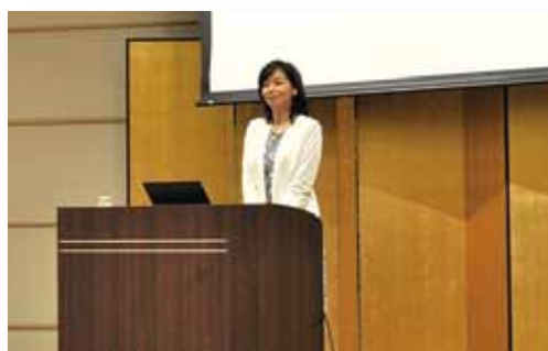
フリーキャスター 伊藤聡子氏による基調講演