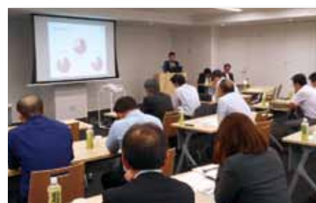
第15回「へきしんグローバルセミナー」を開催 (6月22日)

当金庫では、主要な経営情報を四半期ごとに開示しております。今後とも、積極的な情報開示に努めてまいります。