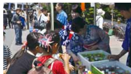
有松絞りまつりにボランティア参加(6月2日・3日)