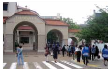
へきしん年金友の会 日帰りバスツアー 「感動の宝塚大劇場観劇」(5月14日～21日)