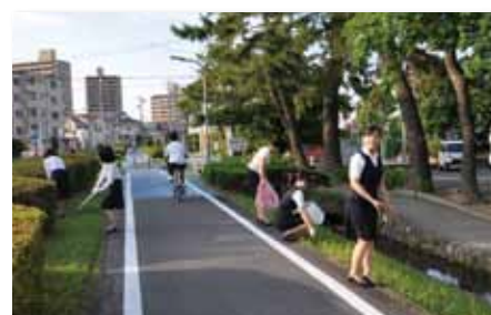
「信用金庫の日」にちなんで全店で地域の清掃活動を実施(6月15日)