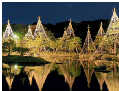
「水鏡」 渡辺 剛さま(安城市) ＜撮影地＞名古屋市 白鳥庭園