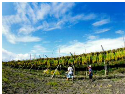
「ふるさとの話をしよう。」 浅岡 由次さま(知立市) ＜撮影地＞安城市 赤松町