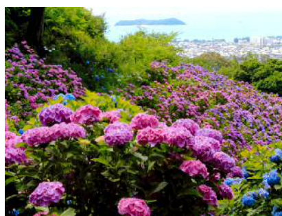
「あじさいの丘」 浅岡 菊雄さま(高浜市) ＜撮影地＞蒲郡市 形原温泉